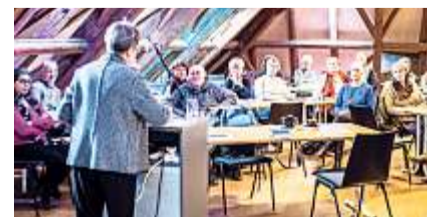
Einige Eindrücke von der Veranstaltung mit Referat und anschliessender individueller Diskussion im Restaurant Hotel Kreuz in Herzogenbuchsee.