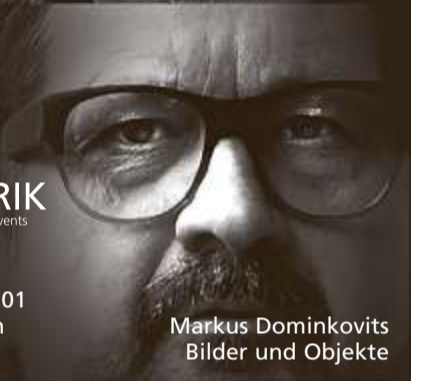
Markus Dominkovits Bilder und Objekte